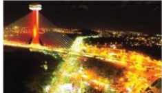
Parte das atividades terão início no Centro de Teresina durante o carnaval.

O Governo do Piauí elaborou um plano de segurança para o carnaval de Teresina e outras cidades do interior. O plano prevê a distribuição de policiais em pontos estratégicos, a instalação de câmeras de segurança e a realização de operações de policiamento preventivo. O plano também prevê a realização de operações de policiamento repressivo em pontos de maior risco.